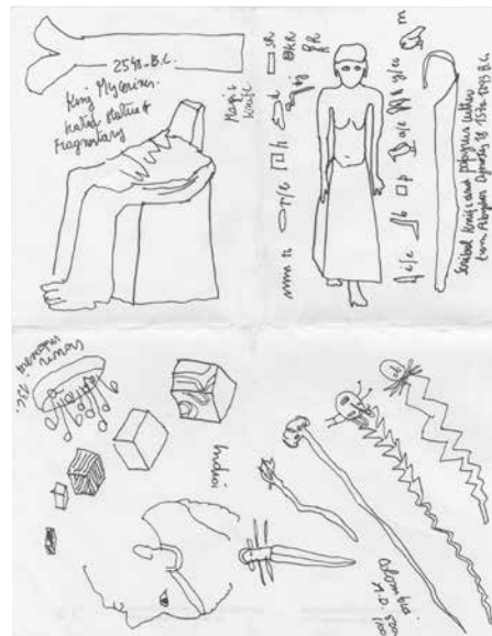
Planche d'atelier 'THIS BOOK LIKE A B.O.O.K.', MUSÉALES NOTES, VOL. 63 ed. 2016: 'NEW YORK (U.S.A.) 2006 - MUNSTER (G) 2013 - PARIS (F)', 2016