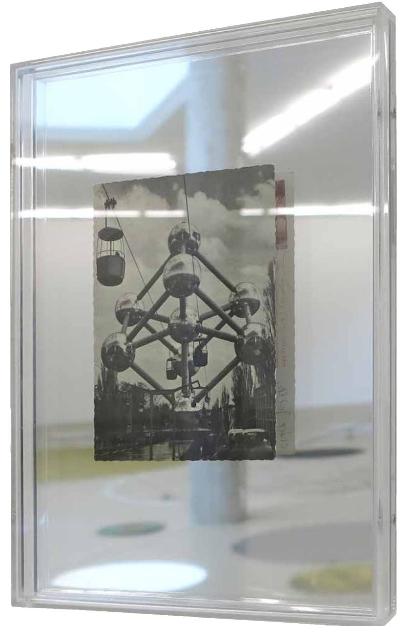
Ensemble Atomium, 2016 (Detail) Postkarte rückseitig signiert von Aglaia Konrad und Willem Oorebeek, 1994