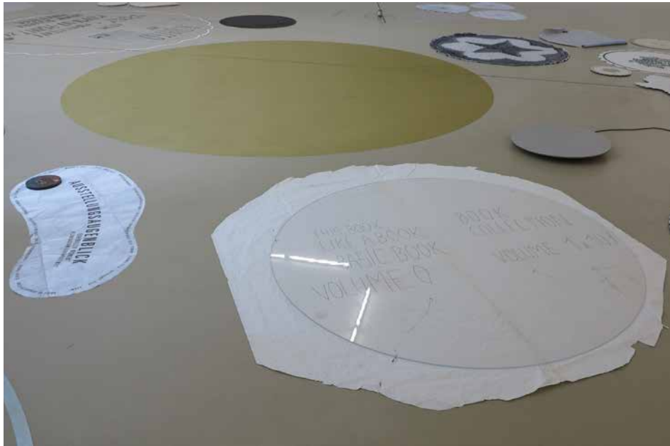
ensemble 'ATOMIC AMALGAME ANNÉE 58' – FLOOR FIGURE 'RONDs-DE-SOL', 2016 (Detail)

the old paper factory, the use of water power, the St.-Alban-Teich canal with its whirlpools, and the memory of the old millstone. Circles, water and paper are thus important components within Tuerlinckx's project, and she treated some of the paper used in the show with water from the Rhine. Into the 19th century, the power supplied by the water of the St.-Alban-Teich provided most of Basel's energy. The importance of the canal in terms of cultural history results from its links with papermaking and the print shops, whose technical sophistication and publishing quality made the city into a centre of humanism in the late 15th and early 16th centuries. Precisely this unique confluence of economic and intellectual value creation is what interests Tuerlinckx.