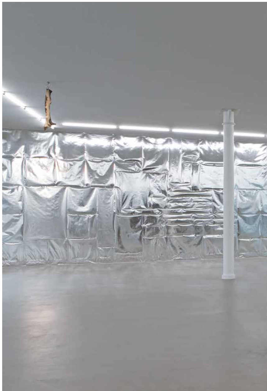
ensemble SILVER room 'NOTHING FOR ETERNITY', 2016 (Detail)