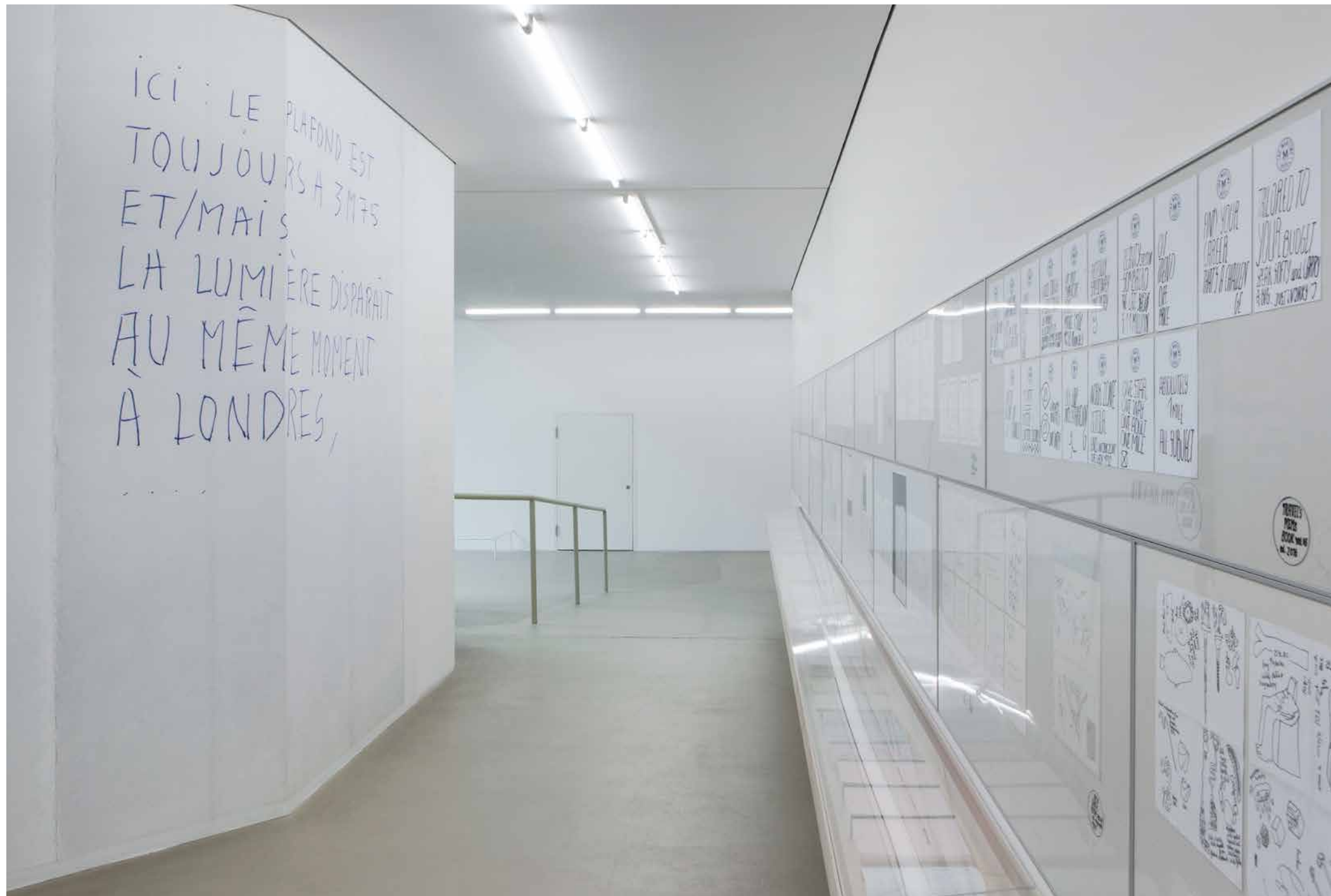
ensemble 'NOTHING FOR ETERNITY/LIKE A BOOK' WALL CORRIDOR 'NOTHING FOR ETERNITY/LIKE A BOOK', 'Ici le plafond...' -page RADIOBOOK COLLECTION B.O.O.K. VOL. 52, 1999-2016