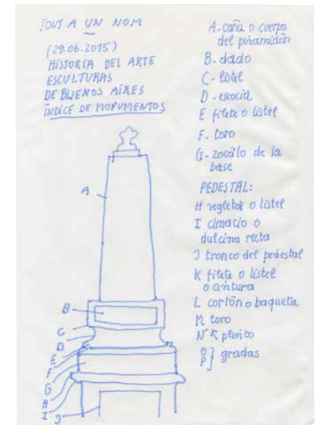
Planche d'atelier 'THIS BOOK LIKE A B.O.O.K.', MUSÉALES NOTES, VOL. 63 ed. 2016: Museales Notes 04 'BASEL 2015 - BUENOS AIRES 2015', 2016

of various types of signals that enter our consciousness every day. Tirelessly, the artist notes and sketches the slogans and advertisements, advice and instructions, scraps of conversation and gestures, radio announcements and other communicative stimuli that reach her every day – even during the tram journey to her studio.