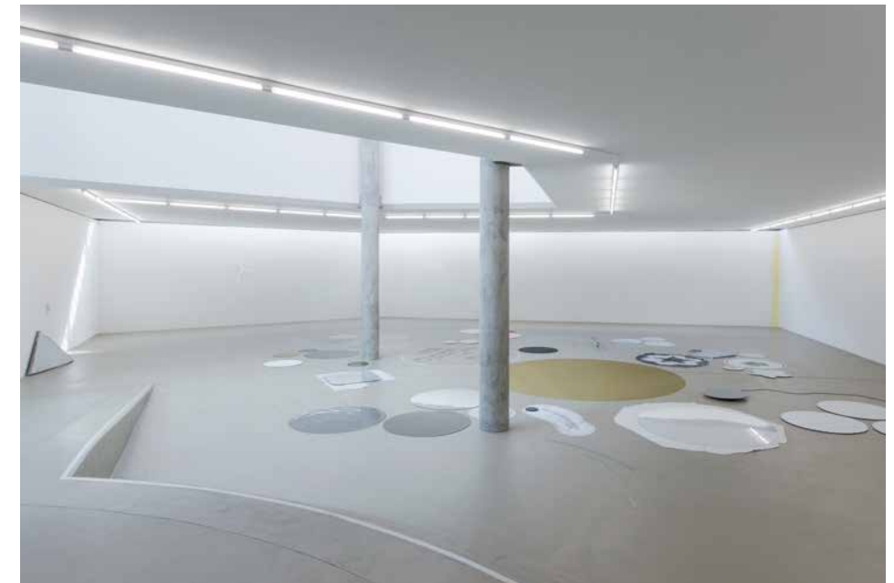
Installationsansicht Joëlle Tuerlinckx NOTHING FOR ETERNITY, Raum 1, 2016

Die Materialien und Motive der Bodenscheiben beziehen sich oft auf Überbleibsel vergangener Ausstellungen, auf Zeichnungen und Fundstücke, die massstäblich vergrössert und dabei häufig auf neue Materialien übertragen werden. Nicht selten handelt es sich um Scans von Abbildungen, Fotos, Zeichnungen und Notizen. Diese werden auf Papier oder Folie ausgedruckt und anschliessend auf passgenau zugeschnittene Aluminiumscheiben aufgezogen, wie zum Beispiel das in Form eines Weinblattes ausgeschnittene Stück, dessen per Hand hinzugefügte Zeichnung einer Blatt-Aderung wie zufällig die Anordnung der Bodenfugen des Ausstellungsraumes zitiert – ein gutes Beispiel dafür, wie genau Tuerlinckx die architektonischen Eigenschaften eines Ortes wahrnimmt und welche Bedeutung sie innerhalb ihres Werkes einnehmen. Die in den Bodenscheiben amalgamierten