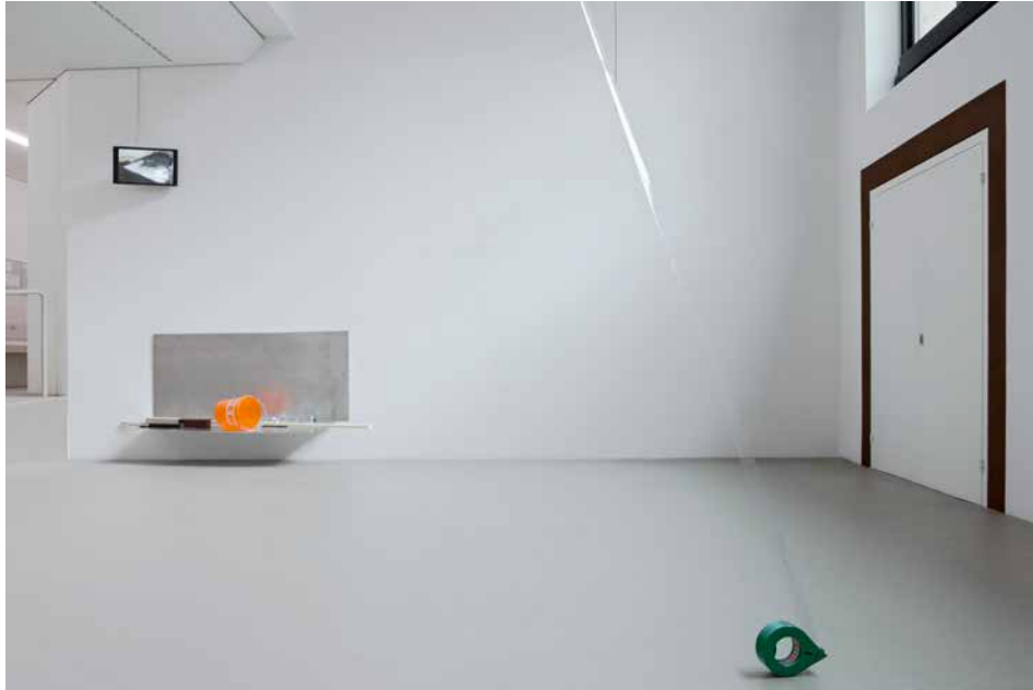
Unten links: VITRINE 'River corner St. Alban-Teich', 15. October 2016 - 26. February 2017 (+ OBJETS TROUVES SUR PLACE), Vordergrund rechts: 'La Grande Chute verte', 2016 (vor Ort gefundenes Objekt), Hintergrund rechts: Typisch lokal Tür 'brun Van Dijck', 2016