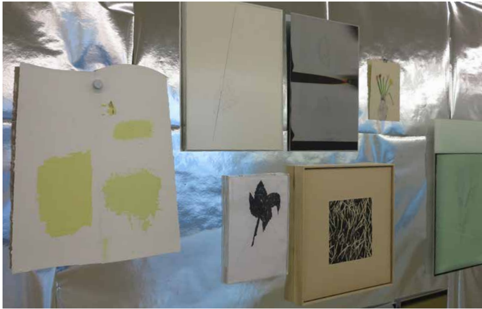
ensemble SILVER room 'NOTHING FOR ETERNITY', 2016 (Detail)