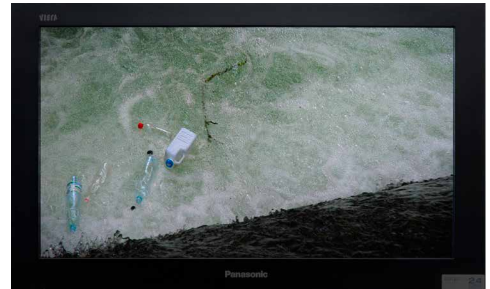
RIVER CORNER-security screen 'St. Alban-Teich' or STUDY FILM 'River corner St. Alban-Teich, Kunstmuseum, Basel', 2015-2016