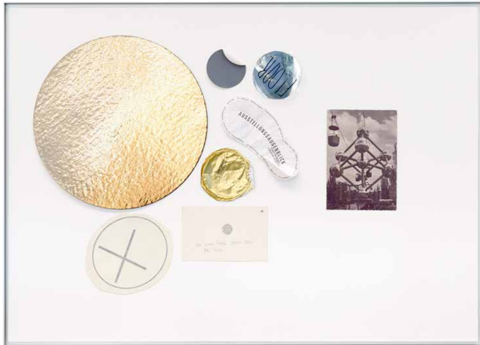
TARTE Gold, neutral Grau, FLOOR, AUSSTELLUNGS AUGENBLICK, ici un trou, X / Atomium -série REBUS 'NOTHING FOR ETERNITY #9', 2016

tion "Material for Local Theory". These pieces of paper, beer mats, wine coasters, packaging, bills, notes, newspaper clippings and other items accumulated over decades fill around a thousand cardboard boxes in the artist's studio. Gold , for example, is a floor painting using gold pigments. The form refers to a 20-fold enlargement of a simple cardboard tray of the kind used in bakeries to sell pieces of cake (this link becomes clear in the Rebus series, where the original cardboard tray appears as part of a collage). For the exhibition, Tuerlinckx transferred the cake tray's golden aluminium coating into a coloured circle roughly 4.5 metres in diameter. For the artist, the painting's metallic-looking surface is related to the shiny, formerly aluminium-clad spheres of the Atomium in Brussels, present in the exhibition in the form of a postcard. In a way, the positioning of the floor discs also distantly echoes the constellation of the atoms within the iron molecule symbolized by the architecture of this building created for the 1958 World's Fair. Transposing this metaphor to the macro-level, perhaps the golden disc is the centre of a small solar system projected into the exhibition space by the floor discs.