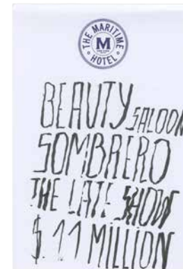
Planche d'atelier 'B.O.O.K.', TRAVEL'S POEMS 'New York', VOL. 65 ed. 2016: 'NEW YORK', 2015