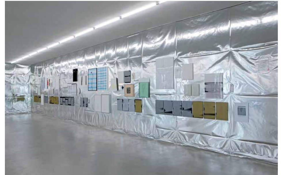
ensemble SILVER room 'NOTHING FOR ETERNITY', 2016 (Detail)

BOUGÉ's gold oder den BOUGÉ's silver , bei denen es sich um Lichtbildkopien von Originalzeichnungen handelt, die Tuerlinckx während des Kopiervorgangs bewegt. Dadurch werden die Motive der Vorlagen gezielt verwackelt, woraus unterschiedliche Wirkungen resultieren: Manche Zeichnungen erscheinen seltsam gedehnt oder geschwungen, bei anderen wurden einzelne Linien im Prozess stroboskopisch vervielfacht – so, dass das Blattwerk und die Stengel zu zittern scheinen. Darauf spielt auch das Wort »bougé« an, das sowohl mit »bewegt« als auch mit »verwackelt« ins Deutsche übertragen werden kann. Tuerlinckx spricht vom »Stottern« der Motive.