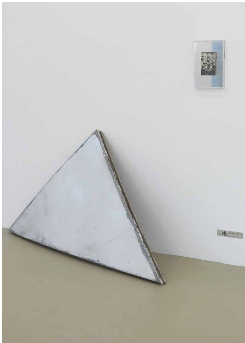
Ensemble Atomium, 2016

Liebe Besucherin der Ausstellung Lieber Besucher der Ausstellung