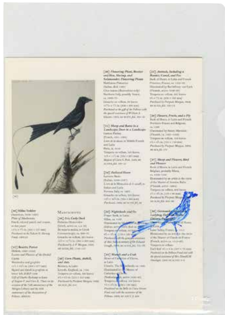
Planche d'atelier 'THIS BOOK LIKE A B.O.O.K.', MUSÉALES NOTES, VOL. 63 ed. 2016: Museales Notes 05 'NEW YORK (USA) 2003', 2016