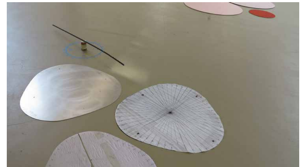
ensemble 'ATOMIC AMALGAME ANNÉE 58' – FLOOR FIGURE 'RONDES-DE-SOL', 2016 (Detail)

Die Form und Anordnung der RONDES DE SOL wurde bereits mit der Konstellation der Kugeln des Atomiums verglichen, dem die Künstlerin ein kleines Ensemble gewidmet hat. Dessen Zentrum bildet ein dreieckiges Fragment aus der Aluminiumhaut, die das bekannte Brüsseler Wahrzeichen ursprünglich bedeckte. Tuerlinckx erhielt das Stück im Zusammenhang mit der Instandsetzung des Gebäudes 2004. Das auf diese Weise als Readymade eingesetzte Objekt verweist auf ihr Interesse an geometrischen Figuren und geometrischer Kunst. Tuerlinckx präsentierte das Atomium-Fragment bereits in einer früheren Ausstellung, damals jedoch mit Stoff umwickelt. Indem sie es verhüllte – wie es einst Man Ray mit einer Nähmaschine in L'énigme d'Isidore Ducasse (1920) getan hatte –, reduzierte sie das Stück auf eine abstrakte Form. Wenn sie das Fragment nun enthüllt zeigt, lotet sie den Abstand zwischen Fiktion und Realität des Gegenstandes aus. Symbolisch stellt das Atomium ein aus der Bindung von neun Atomen resultierendes Metallmolekül dar und kann als Sinnbild für den Titel der Ausstellung NOTHING FOR ETERNITY interpretiert werden: Es erinnert daran, dass Materie