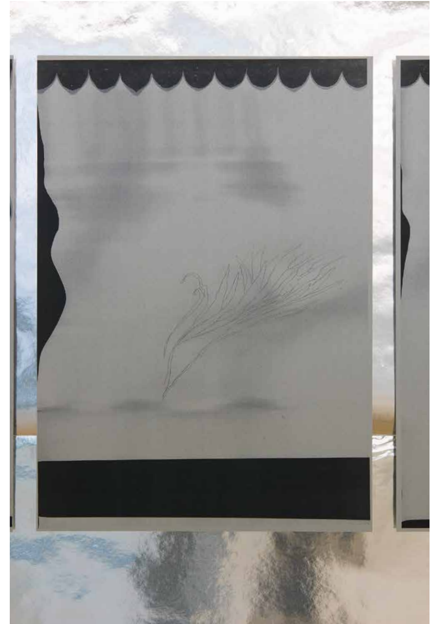
'BOUGÉ silver #10' -série FLEURS Sitterwerk/alu or 'Branche verte baroque #4' -série BOUGÉS fleurs, 2016

Many of the works in this series are copies of copies, causing the plant motifs to shift again and again, looking as if they are being bowed over by a gentle wind. The margins beyond the motif being copied are also subjected to unpredictable blurring and distortion. Other Bougés fleurs are the result of lengthy