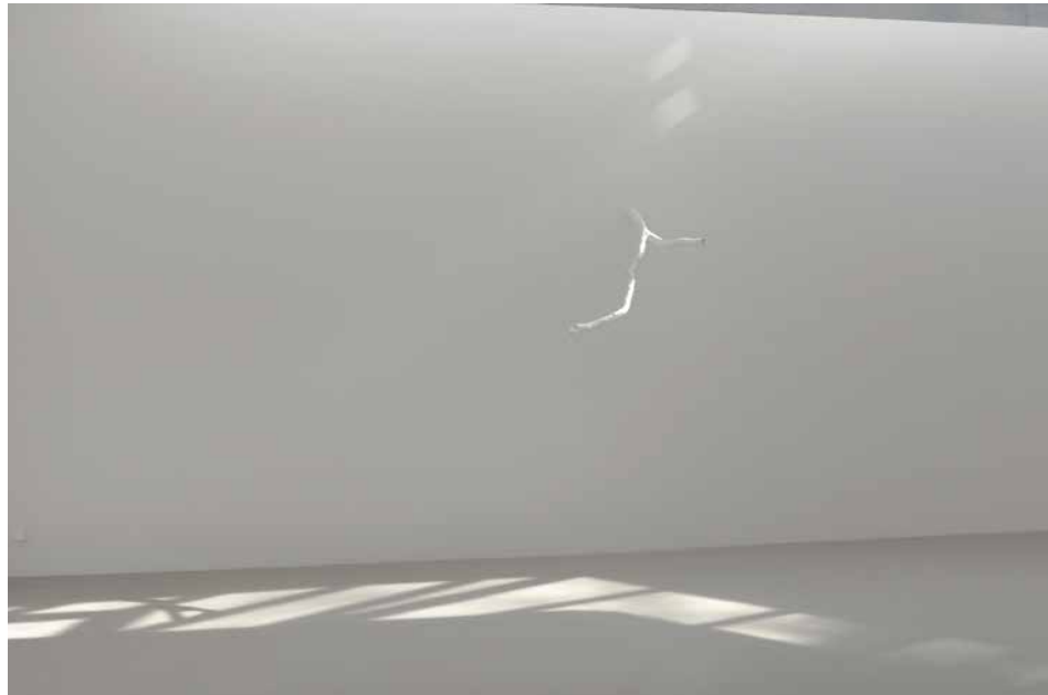
‘Branche Classique’ or ‘CHROMO-BRANCHE NOTHING FOR ETERNITY’, 2016

This special quality of time is also conveyed by the sculptural reproduction of the found branch that seems to be growing through the wall into the museum from outside, as if in a Surrealist dream. A metaphor for the uncontrollability of nature, perhaps? On the other hand, far from looking in any way natural, the branch looks synthetic: its surface is white, like the wall. According to Tuerlinckx, this work was inspired by a piece of folk architecture at the Musée de la Mémoire in Cransac, where plaster was used to simulate tree stumps that were joined to form a fence. Besides this folkloric element, however, the object seems to owe more to the overdrawn reality of Disney's Frozen than to any real (Swiss) forest. It is also unlikely to be a coincidence that the Y-shape of the branch echoes the last letter of the exhibition's title. It also evokes the shape of a stag head trophy seen by Tuerlinckx during her visits to Basel. Images like the branch, the forest, the deer or the trophy – and thus the activity of hunting – focus attention on notions we associate with the concept of “tradition”. Isolated ciphers of the traditional recur throughout the exhibition, for example in the form of a stylized wineglass on an enlarged paper coaster, wood panelling hinted at with brown paint, the baroque ornament of the painted border of an awning in Room 3, or the many floral motifs in the last room. All of these motifs address the