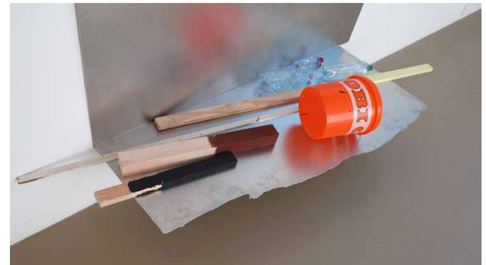
VITRINE 'River corner St. Alban-Teich', 15. October 2016 - 26. February 2017 (+ OBJETS TROUVES SUR PLACE), 2016

Decke wie durch ein schwarzes Segel ersetzt scheint. Das eigentlich durch Tageslichtstoren stets verhängte, von der Künstlerin aber bewusst offen gelassene Fenster erlaubt es dem sonst ausgeblendeten Aussenraum, zu einem Teil der Ausstellungssituation zu werden. Und als von der Decke fallende Linie durchschneidet in Anlehnung an Sol LeWitts geometrische Konstruktion – aber doch auch komplementär zu ihr – ein transparentes Klebeband den Raum wie ein Lichtstrahl.