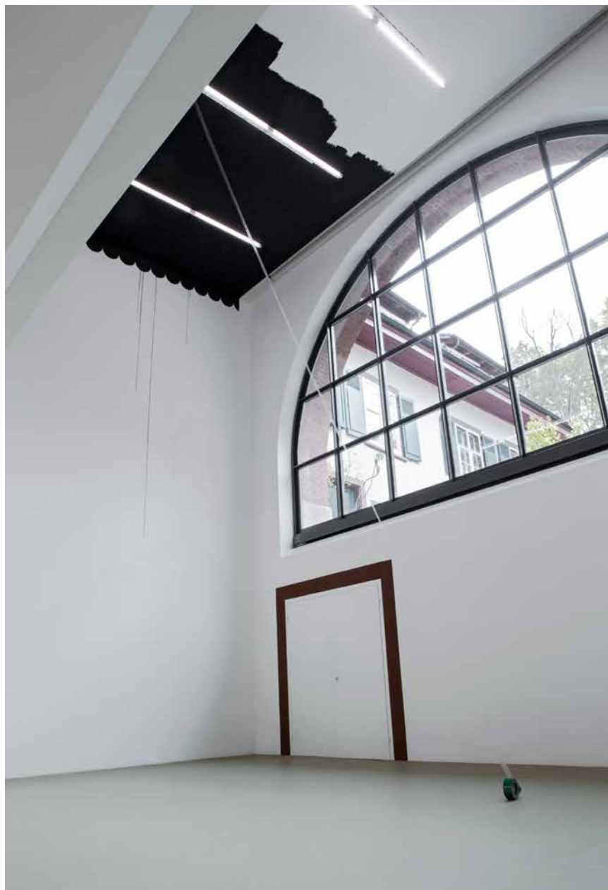
ensemble 'Typisch/Lokal/Schön', 2016 (Detail)

kann. Die Strudel des Wassers und die Gegenstände mit ihren umlaufbahnartigen Kreisbewegungen nehmen zugleich direkten Bezug auf die gezirkelten Bogenlinien des gegenüberliegenden Wandgemäldes von Sol LeWitt.