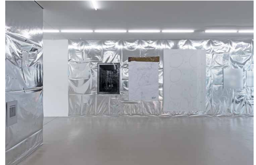
ensemble SILVER room 'NOTHING FOR ETERNITY' (linke Wand): PLAQUE D'ARCHIVE 'GEOMETRICAL BOOK COLLECTION B.O.O.K. VOL. 61 ed 1999/dia-neg', 2016 PLAQUE D'ARCHIVE 'Geldbaum' -série papier Stella Lohaus Galerie , 2016 PLAQUE D'ARCHIVE 'Enveloppe ronds 100, 90, 80, 30, 20, 45, 10, 11, 40, 50, 60, 70', 2016 'Abstract pur aluminisé' (2 + 3), 2016