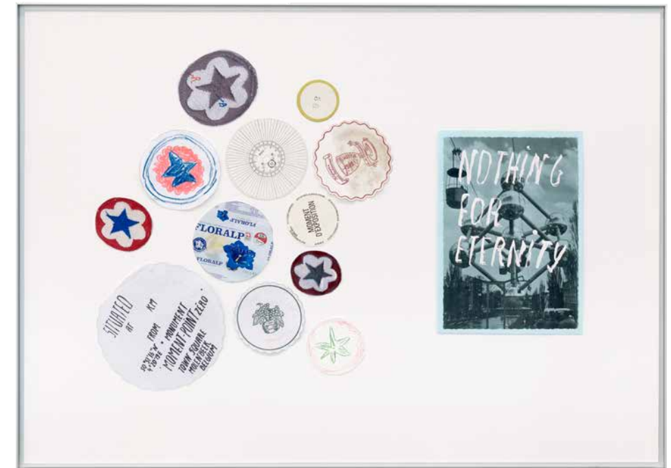
Cuba star color, Cuba star Black/white, Corea mu, Rot Fedlmann, Grune Munsterland, 83, Floralp, Tarte MONUMENT POINT ZÉRO / NOTHING FOR ETERNITY typex -série REBUS 'NOTHING FOR ETERNITY #8', 2016