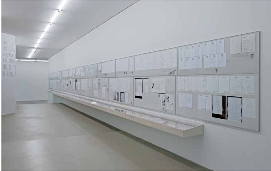
ensemble 'NOTHING FOR ETERNITY/LIKE A BOOK' WALL CORRIDOR 'NOTHING FOR ETERNITY/LIKE A BOOK', 2016 (Detail)