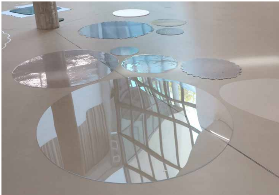
ensemble 'ATOMIC AMALGAME ANNÉE 58' – FLOOR FIGURE 'RONDs-DE-SOL', 2016 (Detail)

Her works result from observing, testing and, as she puts it, "transcribing" these elements: a form of re-reading the real by which she seeks to capture and show things beyond their apparent banality. Using many different artistic approaches and techniques, described in detail in her Lexicon (2012), Tuerlinckx transforms the substance, scale, surfaces and appearance of her raw materials, thus also altering their reality and meaning. Her means include methods from sculpture and painting such as copying, depicting, enlarging, colouring, scanning or (re-)printing, as well as presentation techniques used in museums and archives. In the manner of Marcel Broodthaers, she quotes the didactic figures of various systems of scientific classification, whose rhetoric she wittily copies while rendering it absurd.