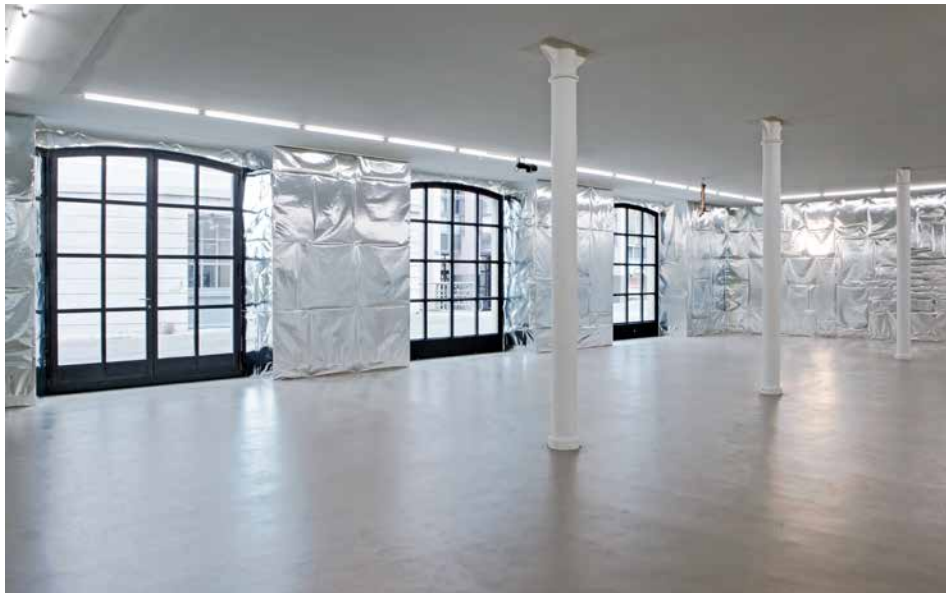
ensemble SILVER room 'NOTHING FOR ETERNITY', 2016 (Detail)

The walls of Room 4 are completely covered with Belgian chocolate wrappers of different formats. Their silver foil coating mirrors the objects and the light, as well as the visitors' movements, making them part of a blurred, three-dimensional tableau. Here, the exhibition seems to focus on figures of the double and the copy, of duplication and being split. For the artist, the chocolate paper, with one coated and one uncoated side, is a symbol of the "two-sidedness of things", in both aesthetic and political terms. Its use in the exhibition creates a link between Switzerland and Belgium, both countries for which the production of chocolate is a matter of national prestige; the business haggling over Belgian chocolate brand Côte d'Or, for example, showed that in the global economy, categories like "tradition" or "region" have become mere marketing rhetoric. With her use of silver, Tuerlinckx also addresses the issue of money, both referred to in French by the word "argent". With regard to money, the "two-sidedness of things" also refers to its flipside: dirty money. The name Côte d'Or, for example, derives from Gold Coast in West Africa (today's Ghana), thus bearing within it the crimes of colonialism, which, among many other things, secured the supply of cocoa beans to European chocolate makers (fortunes made with chocolate provided the capital for several important European art collections).