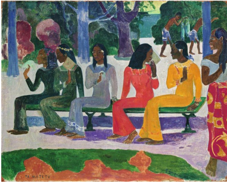
Abbildung: Paul Gauguin, Ta matete (Le marché), 1892 Öl auf Jute, 73.2 x 91.5 cm

Durch diesen Workshop erhalten die Teilnehmenden nicht nur einen Einblick in die Sammlung des Kunstmuseums Basel. Es wird diskutiert, warum einzelne Werke - aus heutiger Sicht betrachtet - wegweisend für neue Epochen waren. Was waren die Beweggründe von Künstler:innen aus den verschiedenen Jahrhunderten neue Wege in Ausdrucksweisen, Darstellungsformen und Inhalten zu finden? Welche herausstechenden Merkmale von Andersartigkeit weisen Kunstwerke auf? Und in welcher Epoche befinden wir uns eigentlich heute?