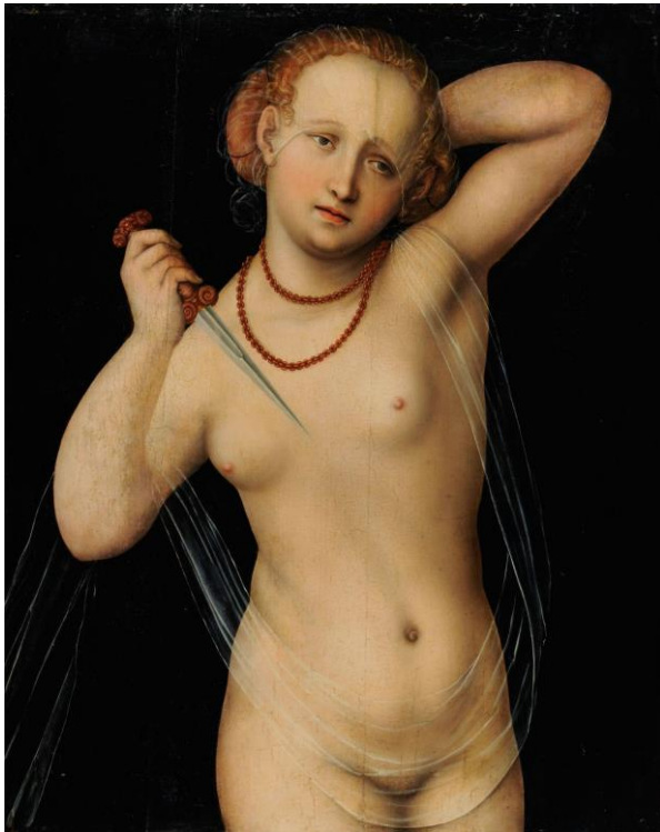
Abbildung: Lucas Cranach d.Ä., Lucretia, um 1535/1540 Öl auf Holz, 79 x 64 cm

Welche Funktion und Verantwortung hat ein Kunstmuseum im Zusammenhang mit intersektionalem Feminismus? Wie beeinflussen künstlerische Positionen unsere Sehgewohnheiten, unsere Wahrnehmung, die Konstruktion von Normalität und unser Vokabular? In diesem Workshop nähern wir uns dem Begriff des intersektionalem Feminismus und hinterfragen die Sammlung mit kritischen Blicken in Bezug auf dargestellte Körper, Gender, Rollenbilder und Sexualität.